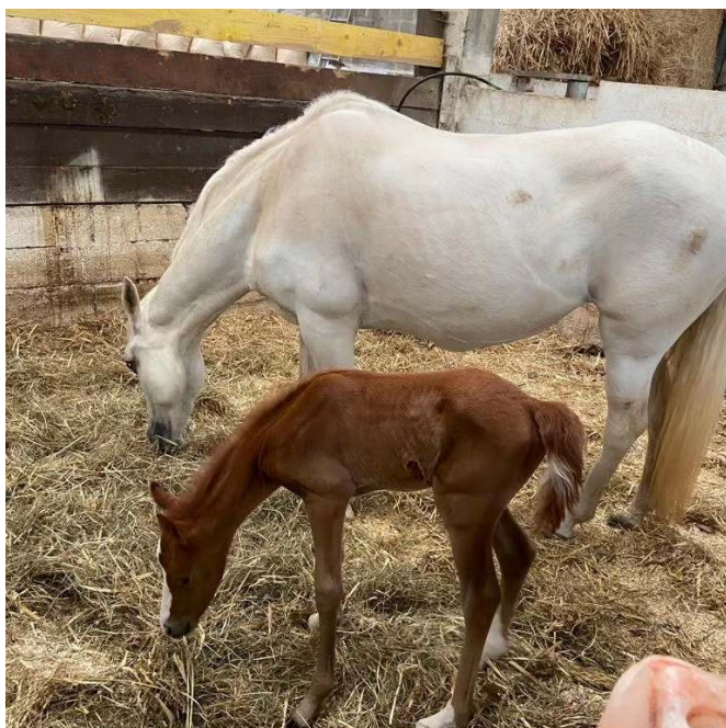
Night light poulain de Rapsodie (Etrier cherbourgeois)