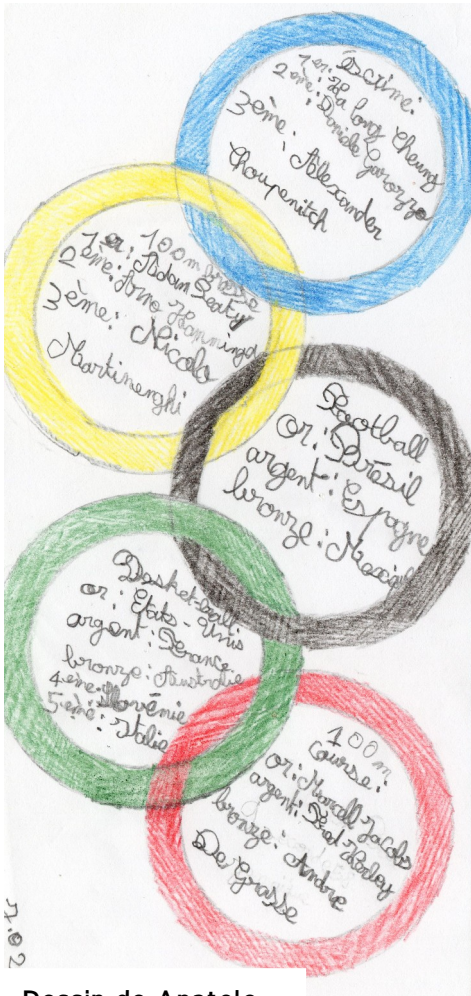
Dessin de Anatole